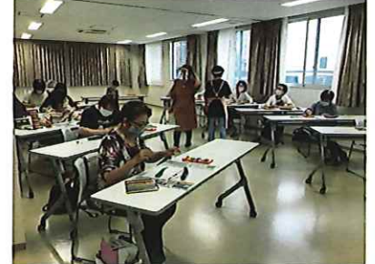
ふれあいいきいきサロン事業