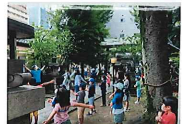
ラジオ体操指導者講習会