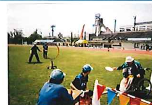
身体障がい者スポーツ大会