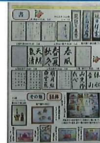
シルバー 趣味の作品展