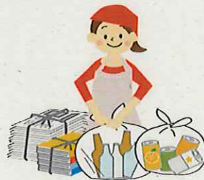
★資源ごみの仕分け