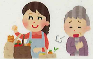
★買物等の付き添い