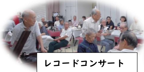
レコードコンサート

生きがいクラブの作品展、サロンの作品展、障がい者施設の写真部展示、防災講座（13時～の座談会）、就労支援事業所紹介、百人一首大会、フラダンス披露・体験、フルート演奏など