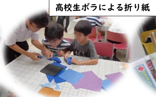
高校生ボラによる折り紙