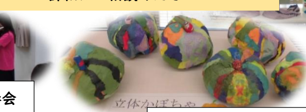
臨床美術サロンによる作品展示