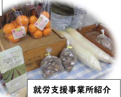
就労支援事業所紹介