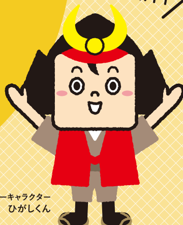
東区いきいき支援センターキャラクター ひがしくん

「いきいき支援センター」は、高齢者のみなさまがいつまでも住み慣れた地域で 安心して生活できるよう、主任介護支援専門員、 社会福祉士、保健師などの専門職がチームとなって 健康・福祉・介護などさまざまな面から高齢者のみなさまを支える機関です。