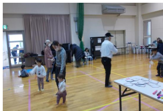
福祉会館共催 お正月遊びの様子