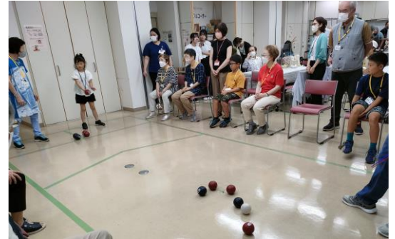
ボッチャ交流大会