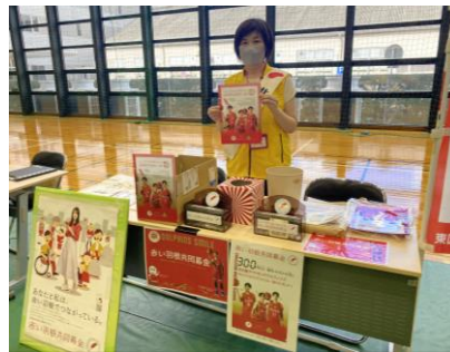
イベント募金の様子