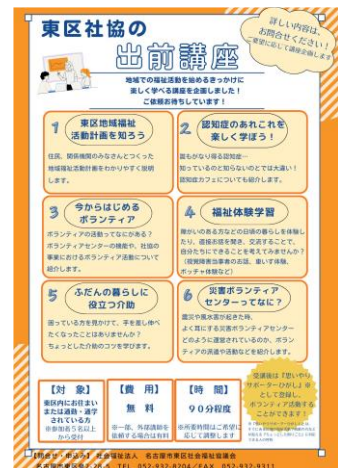
東区社協出前講座 PR チラシ