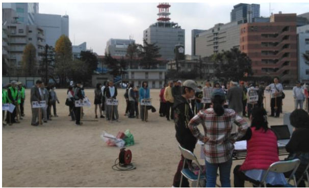
東桜学区 グラウンドゴルフ大会