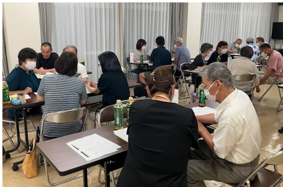
旭丘学区 ふれあいネットワーク会議