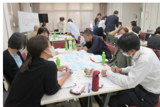
策定作業委員会の様子