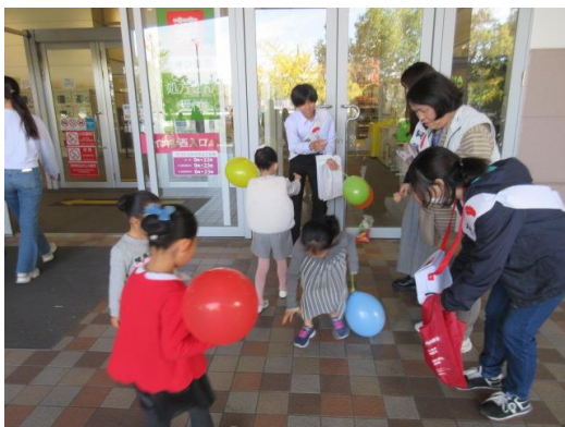
赤い羽根共同募金 街頭募金の様子