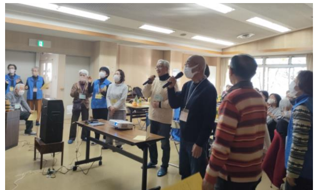
砂田橋学区 福祉交流会