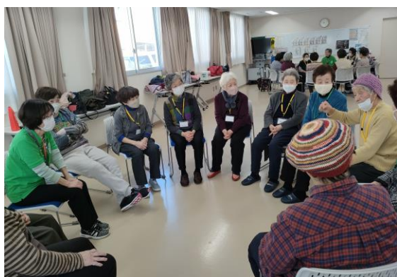
認知症予防リーダーによる回想法