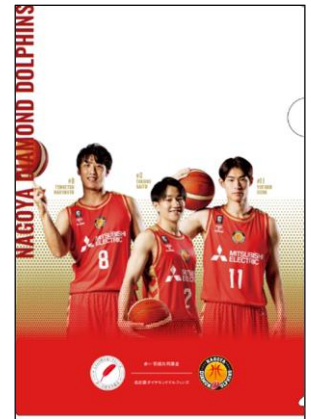
共同制作の クリアファイル