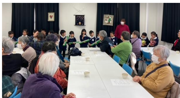
矢田学区 ふれあい給食会（会食・園児との交流）