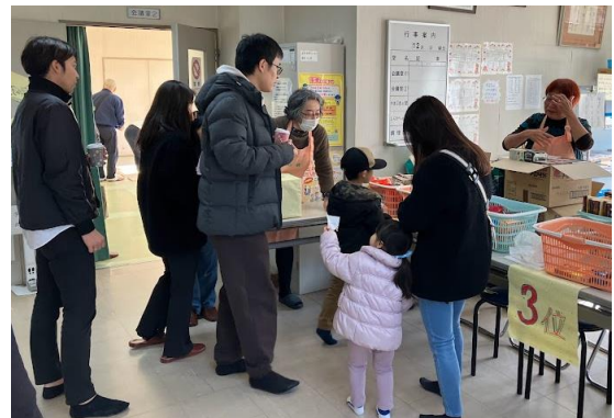
山吹学区 世代間交流お楽しみ会