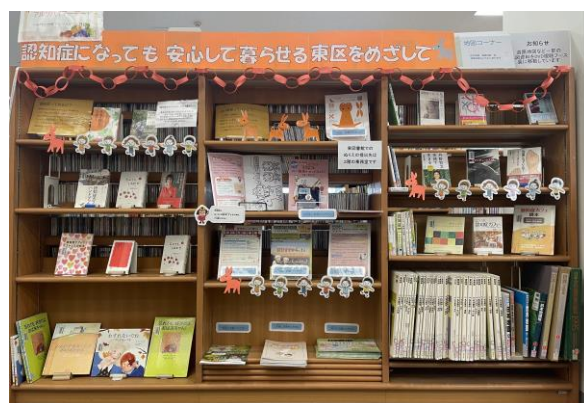
世界アルツハイマー月間の図書館イベント