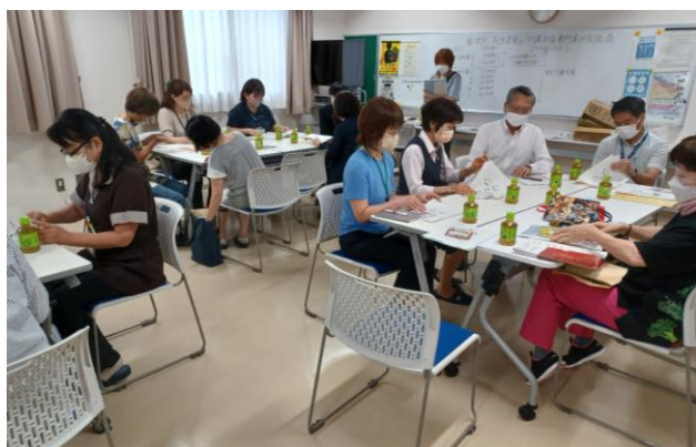
民生委員とケアマネジャーの交流会