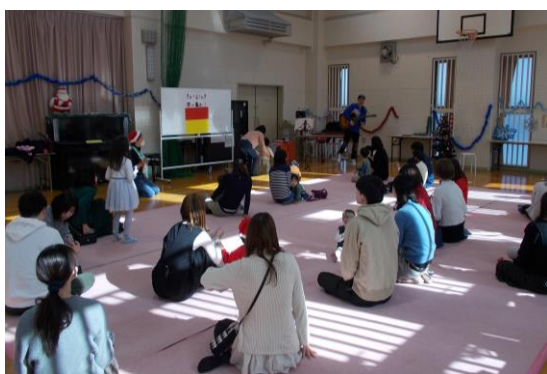
乳幼児対象 クリスマス会の様子