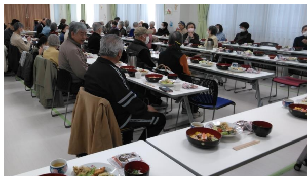
明倫学区 ふれあい給食会（会食）