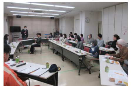
福祉×防災 インクルーシブ防災講座