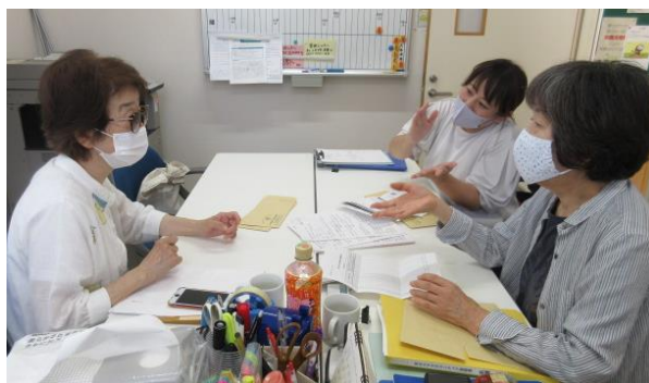
葵学区 ボランティアコーディネーターとの打合せの様子