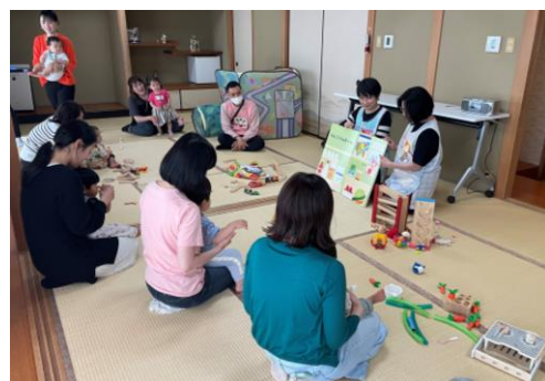
筒井学区 子育てサロン