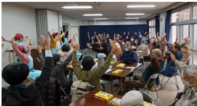
東白壁学区 ふれあい給食会（会食）