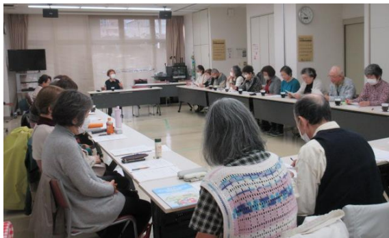
思いやりサポーターひがし フォローアップ講座

実施回数：2回（東区薬剤師会「防災勉強会」、東桜民生児童委員協議会「東区地域福祉活動計画」）