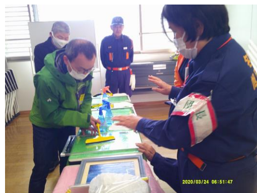
災害ボランティアセンター学習会