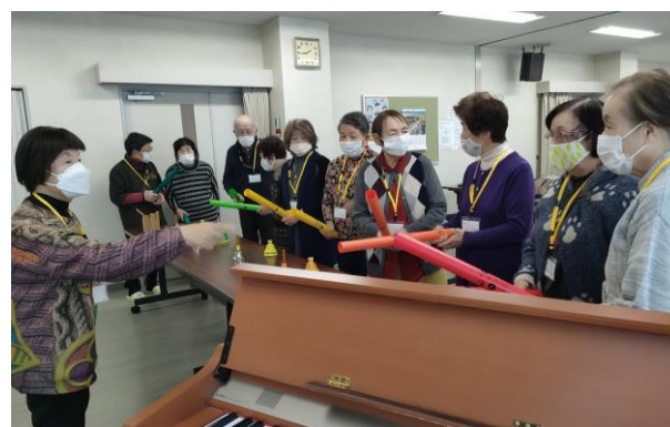
参加者企画によるお楽しみ会