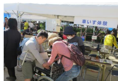
福祉体験コーナー