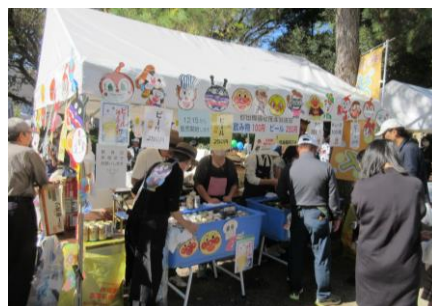
地域福祉推進協議会による模擬店