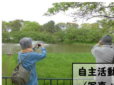
自主活動・地域活動で活動範囲を拡大!