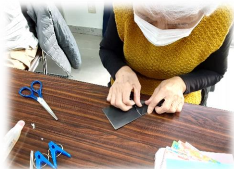
脳トレでさびない心身づくり