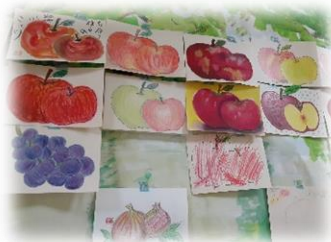
手先を使って作品作り