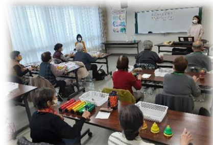
音楽療法で楽しく脳トレ♪

さくらクラブでは、住み慣れた地域の会場で毎週1回、仲間と一緒にさまざまな介護予防をしています。