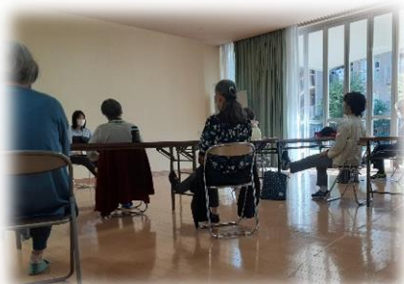
転倒予防に下肢強化体操！