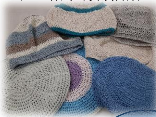
ケア帽子寄付活動