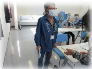
自分を知る！筋力測定